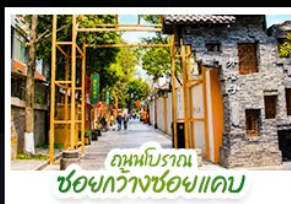
ถนนโบราณ ชอยกวางชอยแคบ