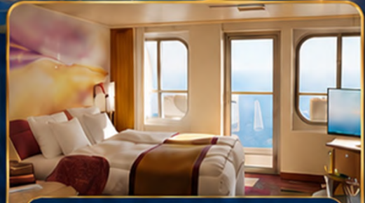
ห้องพักมีระเบียง (Balcony)