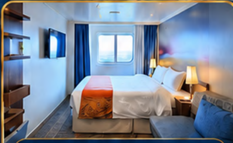
ห้องพักมีหน้าต่าง (Ocean View)