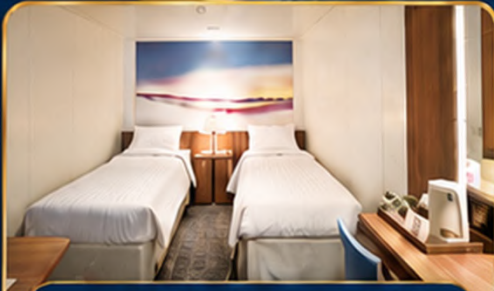
ห้องพักไม่มีหน้าต่าง (Inside)