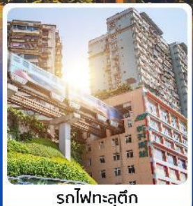
รถไฟฟ้าลัด

ไฮไลท์! เช็กอินตึกตะเกียบ แลนด์มาร์คดังของจงซิ่ง ชมรถไฟฟหาคะลุคิก อลังการแสงสีที่หงหยาดัง