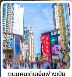
ถนนคนเดินเจี่ยฟางเปี่ย