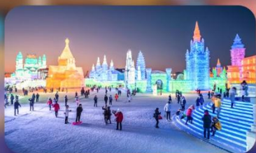
เทศกาลน้ำแข็งฮาร์บิน