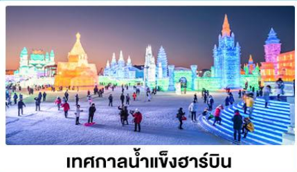
เทศกาลน้ำแข็งฮาร์บิน