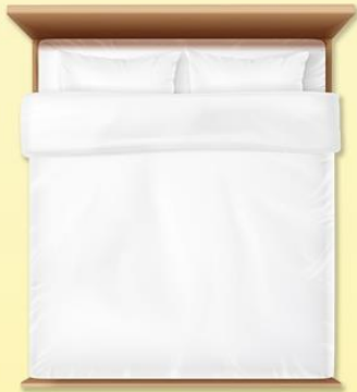
เตียงเดี่ยว DOUBLE

มีเตียงเดี่ยวในห้อง ขนาด 5 - 6 ฟุต นอนได้ 1 - 2 ท่าน