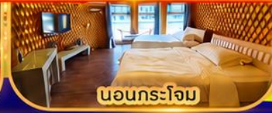
นอนกระโจม