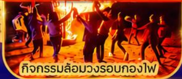
กิจกรรมล้อมวงรอบกองไฟ