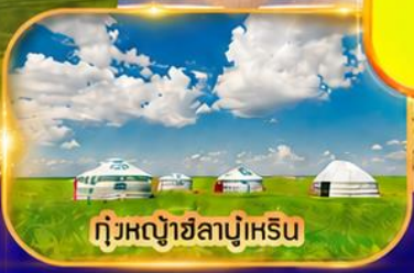
ทุ่งหญ้าชิลานู๋เหริน