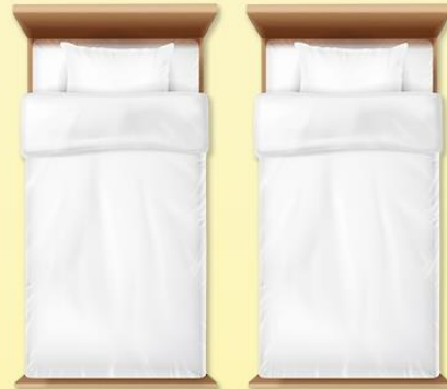
เตียงคู่ TWIN

มีเตียงเดี่ยวในห้อง ขนาด 5 - 6 ฟุต นอนได้ 1 - 2 ท่าน