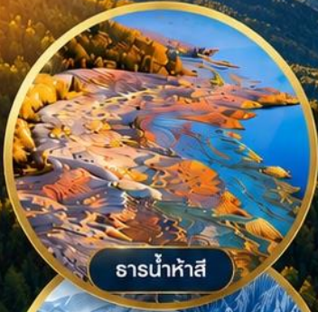
ธารน้ำห้ำสี