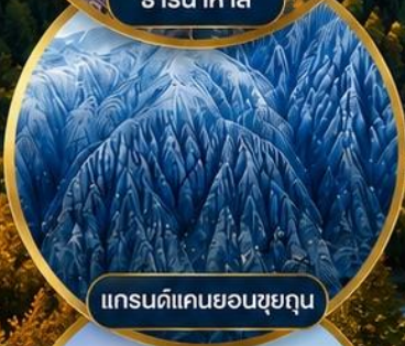
แกรนด์แคนยอนชุยถุน