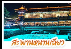
สะพานเสฉวนเมลิยว