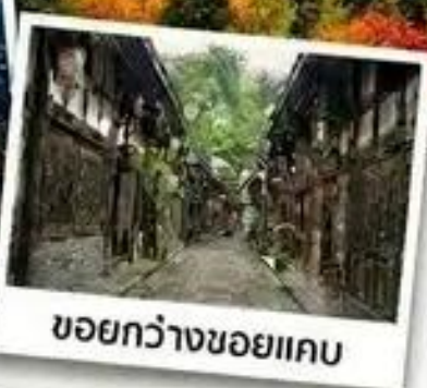
ขอยกว้างขอยแคบ