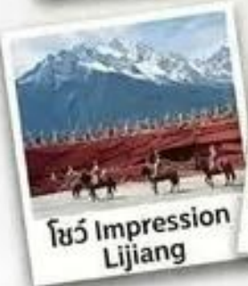
โชว์ Impression Lijiang