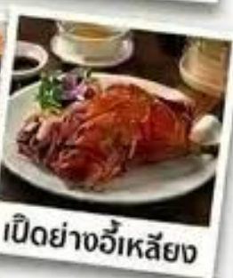
เป็ดย่างฉีหลียง