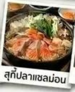
สุกี้ปลาแซลม่อน