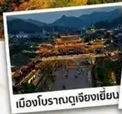
เมืองโบราณตุเจียงเยียน