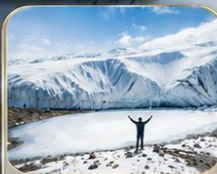
ธารน้ำแข็งมูซตาคาดา (รวมรถกอล์ฟ)