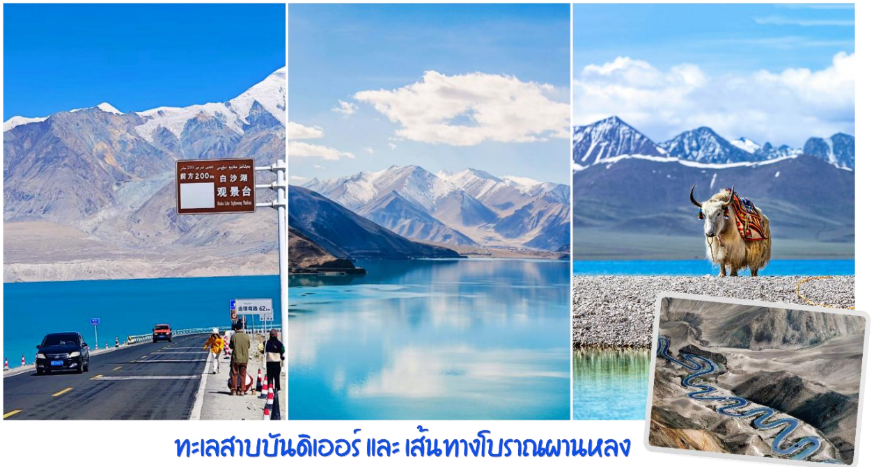
ทะเลสาบบันดิเออร์ และ เส้นทางโบราณผานหลง

นำท่านสู่ ถนนเส้นทางโบราณผานหลง (Panlong Ancient Road) ตั้งอยู่บนที่ราบสูงพามิร์ (Pamir Plateau) เขตเมืองทาจิกอร์กัน (Taxkorgan) ทางตอนใต้ของเขตปกครองตนเองซินเจียงอุยกูร์ ประเทศจีน ถนนบนภูเขาที่คดเคี้ยว เลี้ยวลดอันตระการตาในเขตปกครองตนเองทาจิกอร์กัน (Taxkorgan) ทางตอนใต้ของซินเจียง ประเทศจีน มีฉายาว่า "ถนนมังกรขด" ขึ้นชื่อเรื่องโค้งหักศอกกว่า 600 โค้ง บนภูเขาสูงชัน เป็นแลนด์มาร์กสำคัญสำหรับสายถ่ายภาพและคนรักการเดินทางที่ต้องการท้าทายฝีมือการขับขี่ ให้ทัศนียภาพที่สวยงามและแปลกตาของแนวภูเขาสูงชันและทะเลทรายในเขตซินเจียง จากนั้นนำท่านเปลี่ยนรถเป็นรถ 7ที่นั่ง เพื่อเดินทางสู่ ทะเลสาบบันดิเออร์ ทะเลสาบบันดิร์ (Bandir Blue Lake) หรือ อ่างเก็บน้ำเซียบันตี้ (Xiabandi Reservoir) เป็นทะเลสาบสีฟ้าครามใสบริสุทธิ์ที่ตั้งอยู่ท่ามกลางเทือกเขาพามิร์ ในเขตปกครองตนเองซินเจียงอุยกูร์ ประเทศจีน ขึ้นชื่อเรื่องวิวธรรมชาติที่สวยงามราวกับภาพวาดและน้ำสีฟ้าเข้มอันเป็นเอกลักษณ์จากการละลายของน้ำแข็ง น้ำสีฟ้าเทอร์ควอยซ์ตัดกับเทือกเขาสีน้ำตาลและท้องฟ้าสีคราม เป็นจุดถ่ายภาพที่ยอดนิยมในเส้นทางชมธรรมชาติบนที่ราบสูงพามิร์