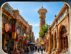
ตลาดอับบาซาร์