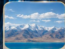
ทะเลสาบซิงไห่ (ไม่รวมรถกอล์ฟ)