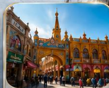
เมืองเก่าคาซการ์ (พิธีเปิดเมือง)