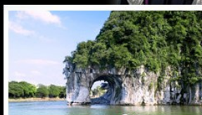
รางวงช้าง