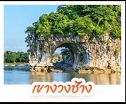
เงามวงช้าง