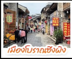
เมืองโบราณเซิงผิง

เช็กอินจุดไฮไลท์กุ้ยหลิน เจดีย์เงินเจดีย์ทอง เงามวงช้าง นั่งเคเบิลคาร์ เคาหรือ จุดชมวิวกะหลูเา แห่งเมืองหยางซัว ล่องเรือแม่น้ำลี่เจียง ตามรอยจ้างหลังภาพรบมิตร 20 หยวน อิสระช้อปปิ้งถนนคนเดิน 2 แห่ง ถนนตงซีเซียง ถนนซีเจีย นั่งกระเช้าบอลลูนชมวิวแบบ 360 องศา