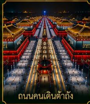
ถนนคนเดินต้าถัง