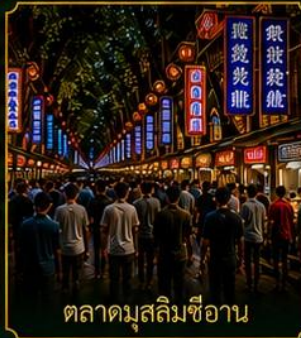
ตลาดมุสลิมซีอาน