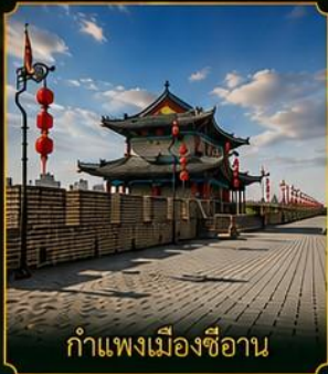
กำแพงเมืองซีอาน