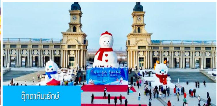
ตึกตาสหะยักซ์