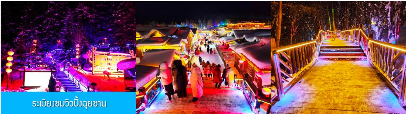
ระเบียงชมวิวยิ่งดูชวน

นำท่านสู่ระเบียงชมวิวยิ่งดูชวน 棒槌山观光栈道 เป็นระเบียงทางเดินชมวิวมุ่บ้านหิมะบนเนินที่ทำด้วยไม้ มีความยาว 3,200 เมตร ระเบียงทางเดินชมวิวนี้นี้ได้พาดผ่านจุดชมวิวยาวงาม ต่าง ๆ ที่สามารถมองเห็นทัศนียภาพที่สวยงามของเมืองในเทพนิยายในมิติและมุมมองที่หลากหลาย เป็นที่นิยมของนักท่องเที่ยวที่ชื่นชอบการถ่ายภาพเป็นอย่างยิ่ง เพราะระเบียงทางเดินชมวิวมุมสวย ๆ ให้ถ่ายรูปตลอดเส้นทาง, เดินบนระเบียงไม่มีค่าใช้จ่ายใด ๆ ท่านสามารถเดินชมวิวดำตามอัธยาศัย จนอิ่มใจ