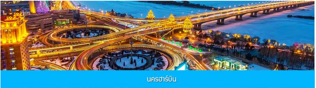
นครฮาร์บิน