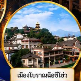
เมืองโบราณฉือซีเซ้า