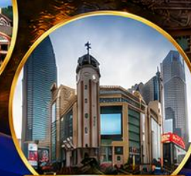
ถนนคนเดินเจียงฟางเป่ย์