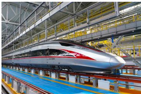
บึร์รถไฟความเร็วสูง

หลังอาหารนำท่านเดินทางสู่สถานีรถไฟความเร็วสูงเมืองฮาร์บิโน เตรียมขึ้นรถไฟความเร็วสูงสู่กรุงปักกิ่ง