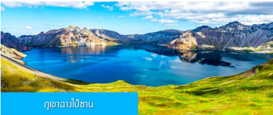
ภูเขาฉางไป่ซาน

วันที่สาม ภูเขาฉางไป่ซาน – ทะเลสาบเทียนจื่อ-น้ำตกฉางไป่ซาน-สระน้ำมรกต-หมู่บ้านวัฒนธรรมเกาหลี เช้า รับประทานอาหารเช้า ณ ห้องอาหารของโรงแรม (4)