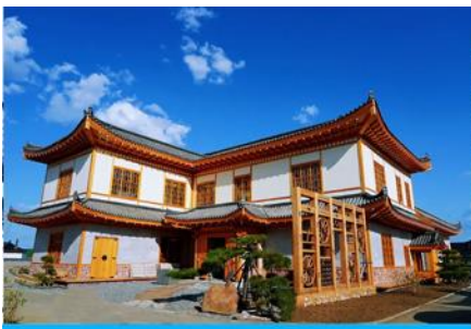
หมู่บ้านวัฒนธรรมเกาหลี

จากนั้นนำท่านเดินทางสู่ เมืองตุนฮว่า 敦化 (ระยะทาง 130 กม. ใช้เวลาเดินทางราว 2 ชั่วโมง)