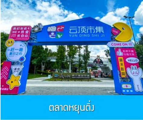
ตลาดหยุนต้ง