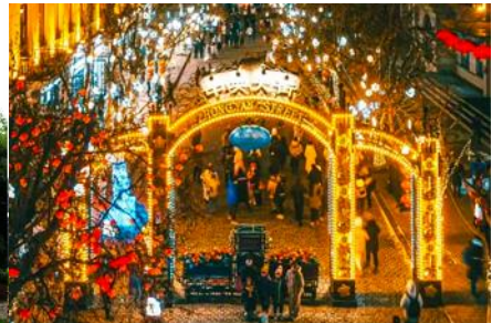
ถนนวยางต้าเจีย