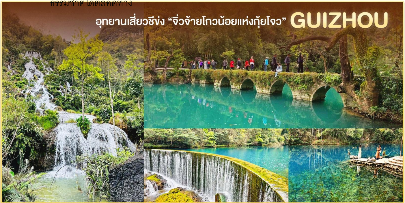
อุทยานเสี่ยวชิ่ง “จิวจ้ายโกวน้อยแห่งกุ้ยโจว” GUIZHOU

เที่ยง ☉บริการอาหารเช้า ณ ภัตตาคาร หลังอาหารนำท่านเดินทางสู่ นำท่านชม อุทยานธรรมชาติเสี่ยวชิ่ง “จิวจ้ายโกวน้อยแห่งกุ้ยโจว” แหล่งท่องเที่ยวระดับ 5AAAAA จากทัศนียภาพที่สวยงามไม่แพ้อุทยานดง บริเวณนี้โดดเด่นด้วยลำธารสีเขียวมรกต ไหลผ่านโขดหินและหน้าผา ก่อเกิดเป็นน้ำตกเรียงรายกว่า 68 ชั้น สวยงามราวภาพวาด ไฮไลต์คือ สะพานเจ็ดรู สะพานหินโบราณที่เคยเป็นเส้นทางลำเลียงสินค้าระหว่างกุ้ยโจว-กวางสี ซึ่งเป็นที่มาของชื่ออุทยาน นักท่องเที่ยวจะได้ชมบึงและแอ่งน้ำธรรมชาติอันงดงาม อาทิ บึงมังกรหมอบ และทะเลสาบหยวนหยาง เส้นทางเดินชมวิวยาวเรียบ เดินง่าย ไม่มีบันได เหมาะสำหรับทุกวัย เพลิดเพลินกับธรรมชาติได้ตลอดทาง