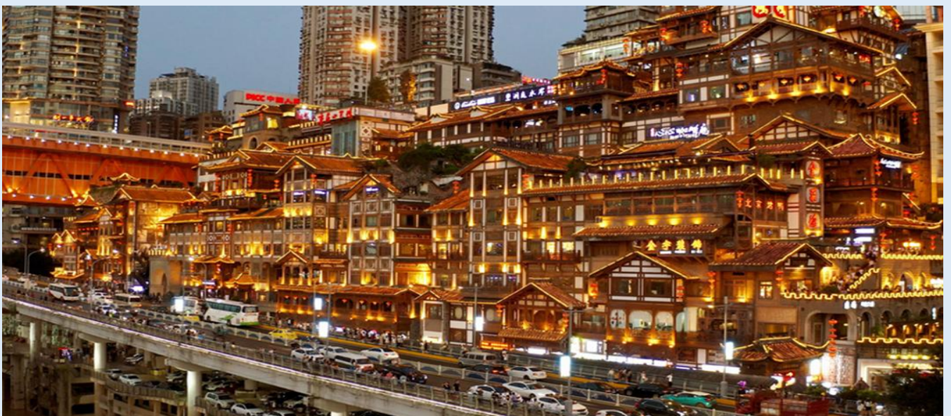
ค่ำ | บริการอาหารค่ำ ณ ภัตตาคาร

จากนั้นนำท่านเดินทางไปที่วิวชม หงหยาดัง หมู่อาคารสถาปัตยกรรมจีนโบราณ 11 ชั้น สร้างอยู่บนหน้าผาริมแม่น้ำเจียหลิง มีเสน่ห์โดดเด่นยามค่ำคืนเมื่อเปิดไฟสว่างไสวคล้ายเมืองในเทพนิยาย ทำให้เป็นจุดชมวิว ถ่ายรูป และแหล่งรวมร้านค้า ร้านอาหาร และของฝาก ที่ผสมผสานวัฒนธรรมเก่าแก่เข้ากับความทันสมัยอย่างลงตัวหลายคนเชื่อว่าคล้ายฉากในภาพยนตร์อานิเมะเรื่อง Spirited Away