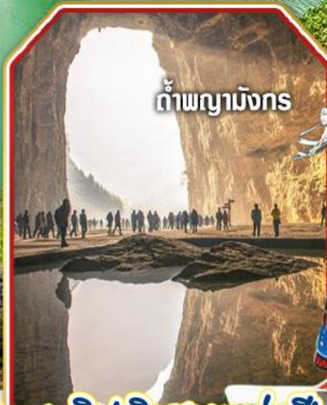
ถ้ำพญามังกร