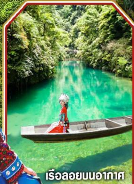
เรือลอยบนอากาศ