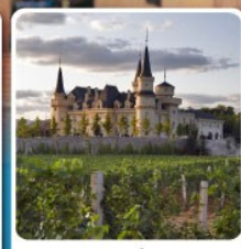
ไรไวน์ จุนยี่ เยียนไถ่