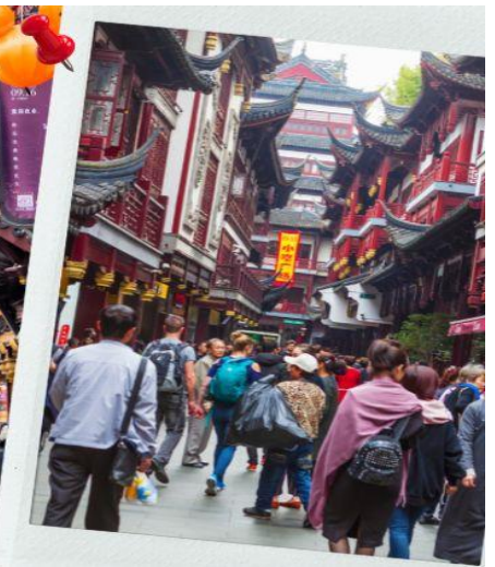
📍 ตึก STARBUCKS