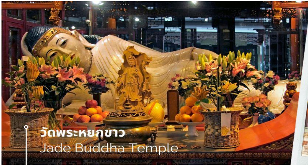
วัดพระหยกขาว Jade Buddha Temple

นำท่านชม วัดพระหยกขาว เป็นวัดที่มีชื่อเสียงมากที่สุดในเมืองเชียงไฮ้ ซึ่งเป็นที่รู้จักจากพระพุทธรูปสององค์ที่สร้างขึ้นจากหยกทั้งแท่ง องค์พระพุทธรูปปางนั่งมีความสูง 190 เซนติเมตร และ หุ้มด้วยเพชรพลอย หิน มโนรา และมรกต และองค์พระพุทธรูปปางไสยาสน์ มีความยาว 96 เซนติเมตร นอนเอียงด้านขวาและหนุนพระเศียรด้วยพระ