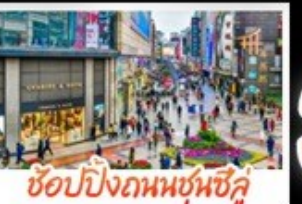
ซอปปิงกบนชุนซึ