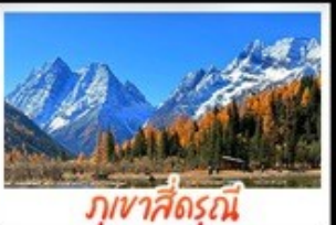
ภูเขาคีร์รุณี