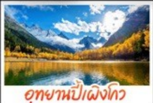
อุทยานป่าแดงโกว

จตุรัสฮางเกียง - หมู่บ้านคานอมซอพี สะพานโบราณหนานเฉียว - อุทยานจิวจ้ายโกว อุทยานค้ำกูบิงชวน - อุทยานป่าแดงโกว อุทยานภูเขาคีร์รุณี - ซอปปิงกบนชุนซึ ซอปปิงกบนโบราณชองกวางชองเคม เมนูพิเศษ! สุกี้หืด สุกี้หม่าล่ารสอบ