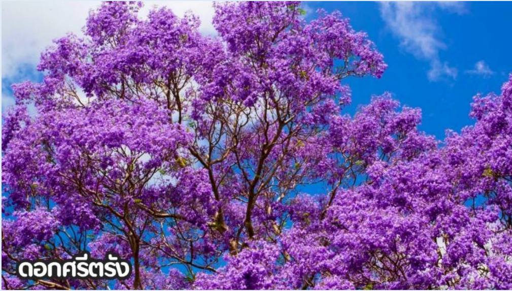
ดอกศรีตรัง

(ปลายเดือนพฤษภาคม-มิถุนายน): ชมดอกไม้ไฮเดรนเยีย ดอกไฮเดรนเยียที่คุนหมิง ประเทศจีน บานสะพรั่งสวยงามที่สุดในช่วงเดือนมิถุนายน โดยเฉพาะบริเวณทุ่งไฮเดรนเยีย (The Middle Sea Hydrangea Kunming) ซึ่งมีหลากสีทั้งฟ้า ชมพู และม่วง เป็นจุดถ่ายรูปยอดนิยมที่ห้ามพลาด เนื่องจากอากาศที่เย็นสบายและทิวทัศน์ที่งดงาม