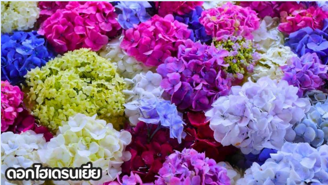
ดอกไฮเดรนเยีย

(ปลายเดือนพฤษภาคม-มิถุนายน): ชมดอกไม้ไฮเดรนเยีย ดอกไฮเดรนเยียที่คุนหมิง ประเทศจีน บานสะพรั่งสวยงามที่สุดในช่วงเดือนมิถุนายน โดยเฉพาะบริเวณทุ่งไฮเดรนเยีย (The Middle Sea Hydrangea Kunming) ซึ่งมีหลากสีทั้งฟ้า ชมพู และม่วง เป็นจุดถ่ายรูปยอดนิยมที่ห้ามพลาด เนื่องจากอากาศที่เย็นสบายและทิวทัศน์ที่งดงาม