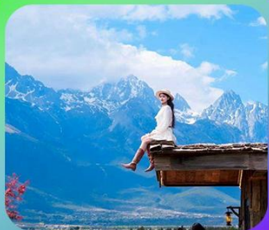
“คาเฟ่ Yun Di An Coffee”