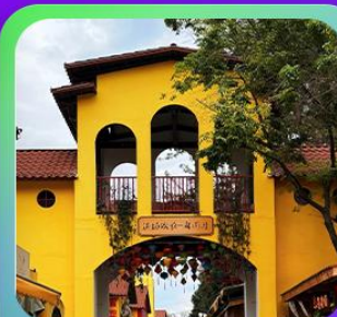
“หมู่บ้านหอนมิตเตอร์เกจ”