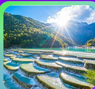
“ทะเลสาบโป้ส่วยเหอ”