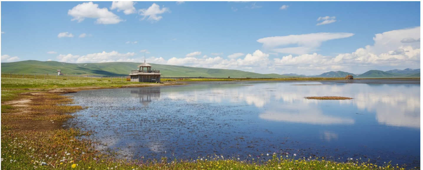
กลางวัน รับประทานอาหารกลางวัน ณ ภัตตาคาร (เมื่อที่ 17)

ขจี อากาศที่นี่บริสุทธิ์และบางเบา มีเพียงเสียงลมที่พัดผ่านยอดหญ้าและเสียงนกน้ำที่ขับขานเป็นท่วงทำนองแห่งธรรมชาติ บรรยากาศอันเงียบสงบจะชะล้างความเหนื่อยล้าให้หมดสิ้นไปในทันที ทะเลสาบแห่งนี้ไม่ได้เป็นเพียงความงดงามทางสายตา แต่ยังเป็นพื้นที่ชุ่มน้ำอันอุดมสมบูรณ์และมีความสำคัญยิ่งต่อระบบนิเวศบนที่ราบสูงทิเบต ถือเป็นแหล่งพักพิงและสวรรค์ของเหล่ากอพยพนานาชนิด โดยเฉพาะอย่างยิ่ง "นกกระเรียนคอดำ" สัตว์ปีกสง่างามอันเป็นสัญลักษณ์แห่งความสุขและอายุยืนยาวในวัฒนธรรมทิเบต ในช่วงฤดูร้อนทุ่งหญ้ารอบทะเลสาบจะผลิดอกไม้ป่านานาพรรณ กลายเป็นภาพวาดสีสันสดใสที่ธรรมชาติรังสรรค์ขึ้น เชิญท่านทอดน่องไปตามสะพานไม้ที่ทอดยาวเหนือผืนน้ำ สูดอากาศอันแสนสดชื่นให้เต็มปอด พร้อมเก็บภาพความประทับใจของผืนน้ำจรดขอบฟ้า ที่ซึ่งฝูงปศุสัตว์ของชาวทิเบตพื้นเมืองกำลังเล็มหญ้าอย่างอิสระอยู่ไกลๆ