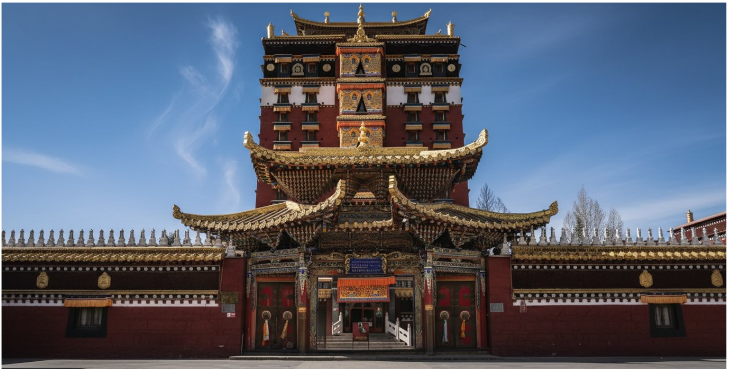
บ่าย นำท่านเดินทางสู่ หอพระมิลारेปะ (ระยะทาง 134 ก.ม. ใช้เวลาเดินทางประมาณ 2 ชั่วโมง) สู่ใจกลางศรัทธา หอพระ 9 ชั้น มิลारेปะ สถาปัตยกรรมทางพุทธศาสนาที่น่าอัศจรรย์ใจและเป็นหนึ่งเดียวใน