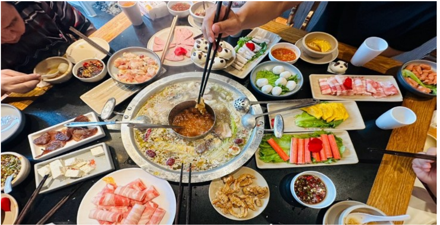
คำ รับประทานอาหารคำ ณ ภัตตาคาร (เมื่อที่ 12) *เมนูพิเศษสุกี้หมอลำเสฉวน