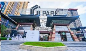
ห้าง G Park