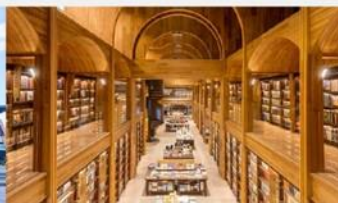
ห้องสมุด Fang Suo