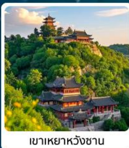
เขาเหย้าหวังชาน