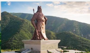
บ้านเกิดท่านกวนจู