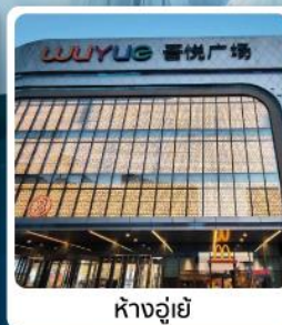
ห้างอู๋ยี่

ไอล่า! เช็คอนถ้ำน้ำแข็งหมื่นปี พร้อมพิชิตวิวอลังของอวิ้นชีวซาน