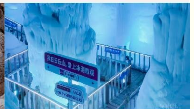
ถ้ำน้ำแข็งอวี่นชีวซาน

*ทางบริษัทฯ ขอสงวนสิทธิ์ในการสลับโปรแกรมทัวร์ตามความเหมาะสมขึ้นอยู่กับสถานการณ์หน้างาน โดยคำนึงถึงผลประโยชน์ของลูกค้าเป็นสำคัญ