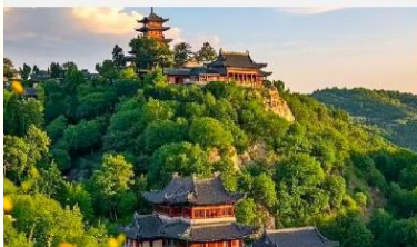
เขาเหยาหวังซาน