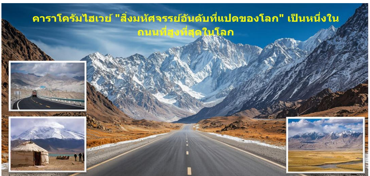
คาราโครัมไฮเวย์ "สิ่งมหัศจรรย์อันดับที่แปดของโลก" เป็นหนึ่งในถนนที่สูงที่สุดในโลก

08.00 น. นำท่านออกเดินทางจาก "เมืองคัชการ์" (Kashgar หรือ Kashi) ในซินเจียง เป็นเมืองหน้าด่านประวัติศาสตร์บนเส้นทางสายไหมทางตะวันตกสุดของจีน ซึ่งเป็นจุดเริ่มต้นของ "คาราโครัมไฮเวย์" (KKH) ทางหลวงมิตรภาพจีน-ปากีสถาน ที่สูงและสวยงามที่สุดสายหนึ่งของโลก เชื่อมต่อเมืองคัชการ์ของจีนกับเมืองฮาซานอับดาลในปากีสถาน รวมระยะทางประมาณ 1,300 กิโลเมตร ตัดผ่านเทือกเขาคาราโครัม