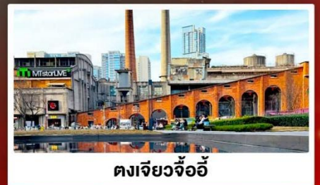
ตงเจียวจ้ออี้