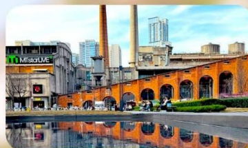
ตงเจียวจื่ออี้