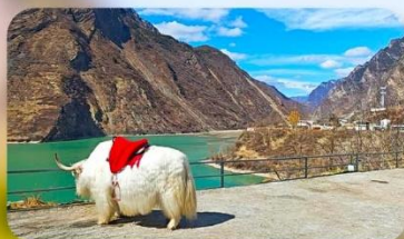
กะเลสาบเต๋อซี