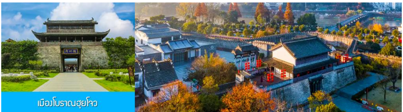
เมืองโบราณฮุยโจว

เที่ยง รับประทานอาหารกลางวัน ณ ภัตตาคาร (10)