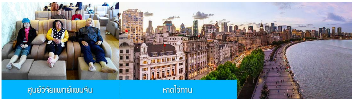
ศูนย์วิจัยแพทย์แผนจีน