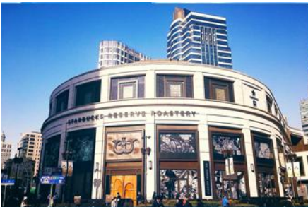
Starbuck Reserve Roastery