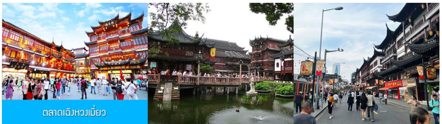
ตลาดเจิงหวงเมี่ยว