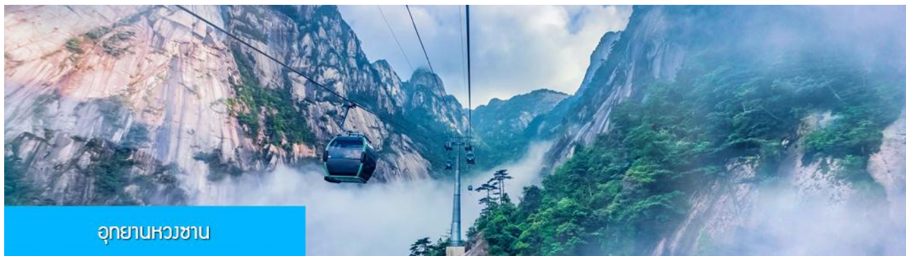
อุทยานหวางซาน