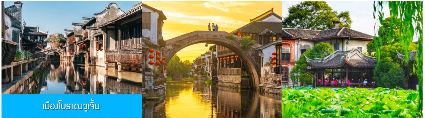
เมืองโบราณวูเจิน

เที่ยง รับประทานอาหารกลางวัน ณ ภัตตาคาร (7)