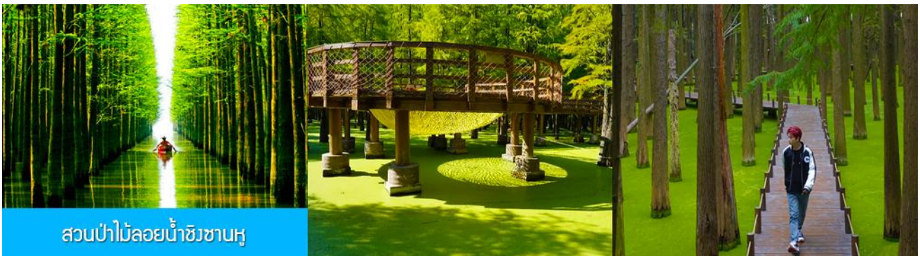
สวนป่าไม้ลอยน้ำชิงซานหู

หลังอาหารเช้าท่านเดินทางโดยรถบัสสู่เมืองหลิงอัน 临安市 (ระยะทาง 175 กม. ใช้เวลาเดินทางราว 2 ชั่วโมงเศษ)