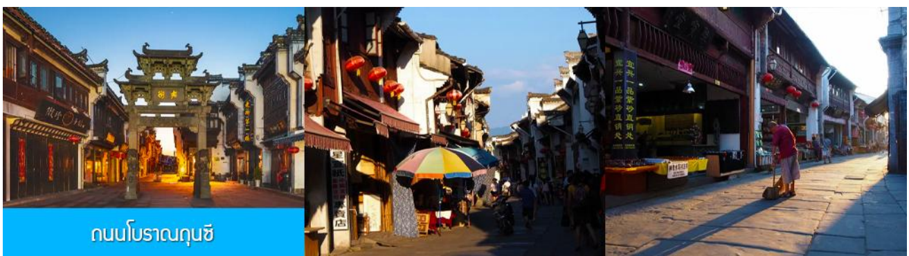
ถนนโบราณถุนซี

เที่ยง อิสระอาหารมื้อกลางวัน ( ท่านสามารถเลือกชิมอาหารพื้นเมืองในระแวกโรงแรมได้ตามอัชฌาศัย )