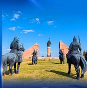
สวนสาธารณะเจงกิสข่าน