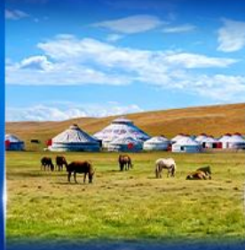
ทุ่งหญ้าออร์ดอส