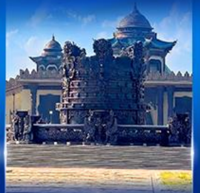
ศูนย์วัฒนธรรม มองโกเลีย หอขงหลิว