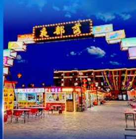
ตลาดกลางคืน ทาเลาเตอวี