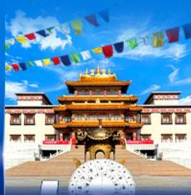
วัดพระโพธิสัตว์ ภูเขา