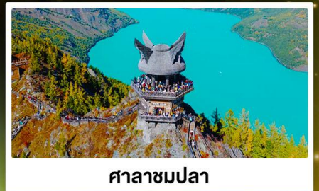
ศาลาชมปลา