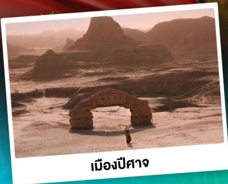
เมืองปีศาจ