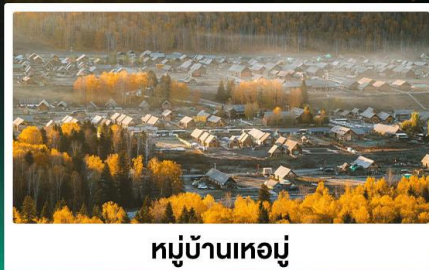
หมู่บ้านหอยมู