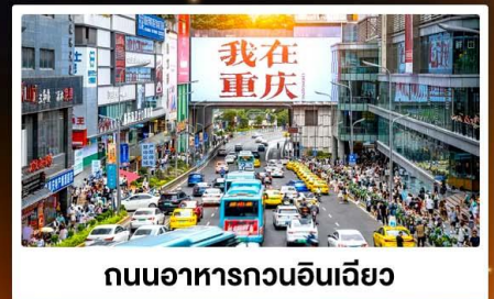
ถนนอาหารกวนอันเฉียว