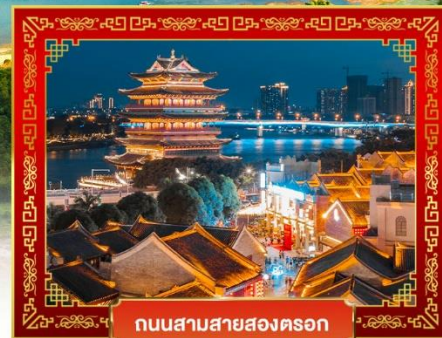
ถนนสายสองครอก