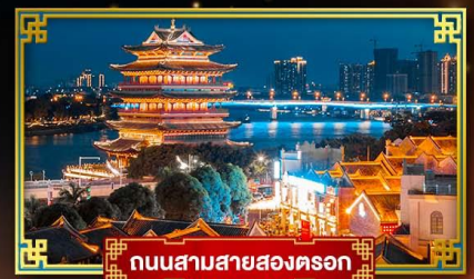
ถนนสามสายสองตอรอก