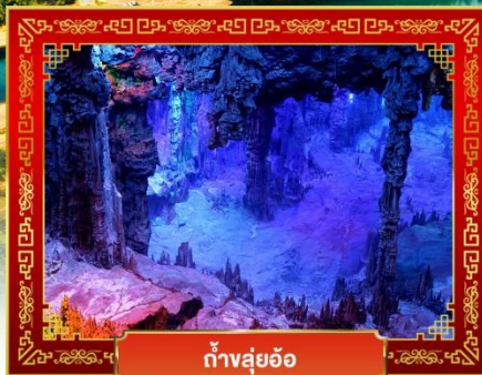
ถ้ำลุย้อ