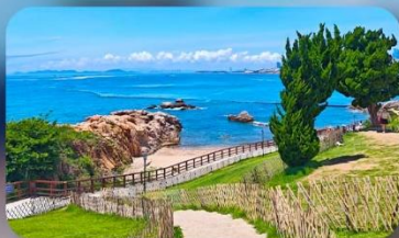
เกาะสี่เหลี่ยมเต่า