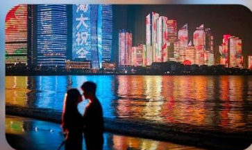
ชายหาดหมายเลข 3