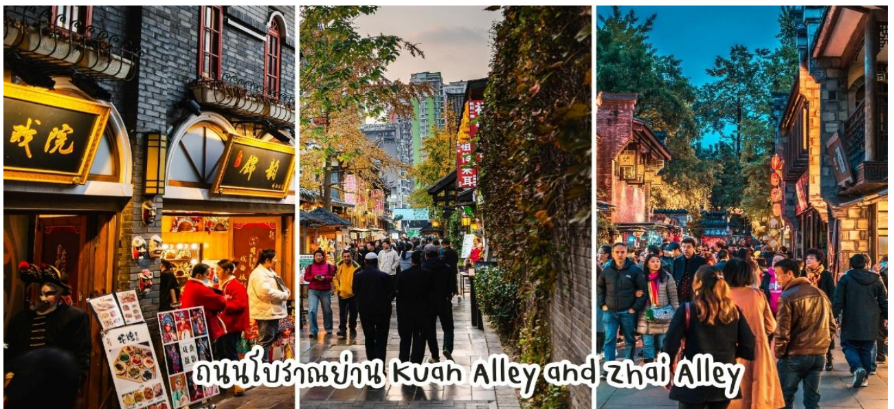
ถนนโบราณย่าน Kuan Alley and Zhai Alley

เช้า บริการอาหารเช้า ณ ห้องอาหารของโรงแรม จากนั้นนำท่านเดินทาง ซ้อปั้งซอยกว้างซอยแคบ เป็นถนนที่แสดงถึงเสน่ห์ของการตกแต่งด้วยเรื่องราววิถีชีวิตการเป็นอยู่ของคนจีน เฉิงตูในสมัยโบราณ ที่มีการผสมความเป็นทันสมัยเข้าไปอย่างลงตัว ถนนคนเดินมี 3 ซอย แต่ละซอยมีความยาวประมาณ 400 เมตร มี ร้านค้าเล็กๆ ตั้งเรียงรายอยู่ในแต่ละซอยและตรอกให้เดินช้อปปิ้งเพลิน ทั้งร้านหนังสือ ร้านชา-กาแฟ บาร์ เสื้อผ้า ไปจนถึงร้านอาหาร นานาชนิด มีจำหน่ายสินค้าพื้นเมือง ขนม ร้านอาหาร รวมทั้งของฝากให้ท่านได้ถ่ายรูปและเลือกซื้อ