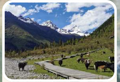
กู่หงญาเหรินเซินกั่วผิง (Renshou Guoping)