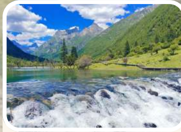
ทะเลสาบหลงจู่ซั่ว (Long zhu cho lake)