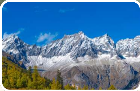
จุดชมวิว (Hongshanlin)