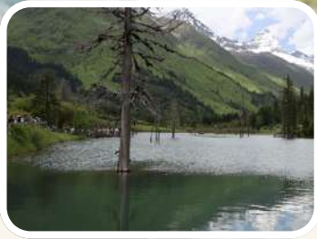
ซื่ออู่น่าซั่ว (Sigu Nacuo)