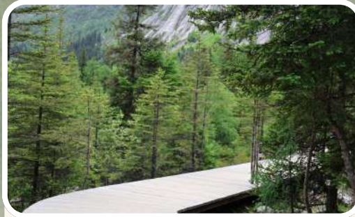
ป่าหงซานหลิง (Redwood Forest)