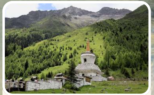
ปู้ต๋าเลาเฟิง (Potala Peak)