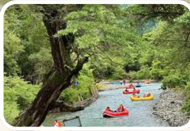
เหมียนหญูป้า (Redwood Forest)