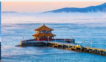
สะพานจันเจียว