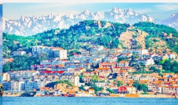
หมู่บ้านชาวประมงซาจื่อโซ่ว