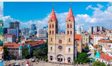
โบสถ์คริสต์เซนต์ไมเคิล

*ทางบริษัทฯ ขอสงวนสิทธิ์ในการสลับโปรแกรมทัวร์ตามความเหมาะสมขึ้นอยู่กับสถานการณ์หน้างาน โดยคำนึงถึงผลประโยชน์ของลูกค้าเป็นสำคัญ