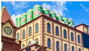
พิพิธภัณฑ์เบียร์ชิงเต่า