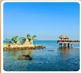
เกาะหย่างหม่า