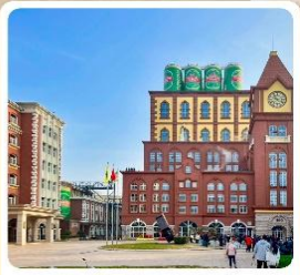
พิพิธภัณฑ์เบียร์