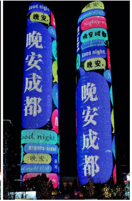
Chengdu Twin Tower