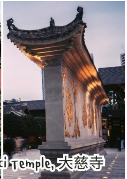
Daci Temple, 大慈寺