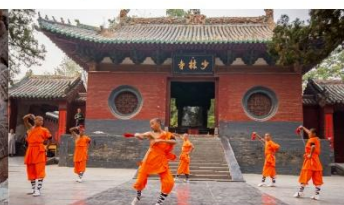
ชมโชว์กังฟูเส้าหลิน

*ทางบริษัทฯ ขอสงวนสิทธิ์ในการสลับโปรแกรมทัวร์ตามความเหมาะสมขึ้นอยู่กับสถานการณ์หน้างาน โดยคำนึงถึงผลประโยชน์ของลูกค้าเป็นสำคัญ