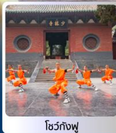
โชว์กังฟู