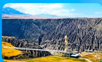
แกรนด์แคนยอนคูซานจื่อ