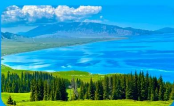
ทะเลสาบไซ่หลี่มู่