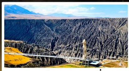
แกรนด์แคนยอนคูซานจื่อ