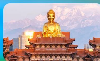
วัดพระใหญ่หวงกงชาน