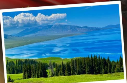
ทะเลสาบไซทสี่มู่

★ ชมวิวสุดอลังการแบบยุโรปผสมเอเชีย ทุ่งหญ้าเขียวฉ่ำ ทะเลสาบสีเทอร์ควอยซ์