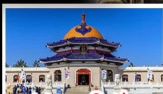
สุสานเจกิสซ่า