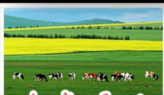
ทุ่งหญ้าเจอร์ดอส

ทุ่งหญ้าเจอร์ดอส สุสานเจกิสซ่า แกรนด์แคนยอนแม่น้ำเดสิอง