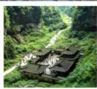
หลุมฟ้าสะพานสวรรค์