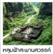
หลุมฟ้าสะพานสวรรค์