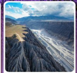
แกรนด์แคนยอนคู่ซานจื่อ