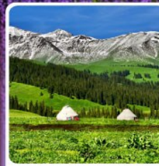
ทุ่งหญ้านาฬิกา