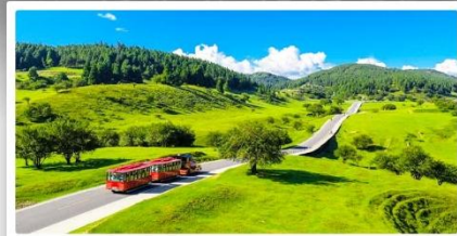
เทานางฟ้า

เดินทางโดย: สายการบินฉงชิ่งเจียงเป๋ย (PN)