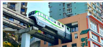
รถไฟฟ้าสุดคึก