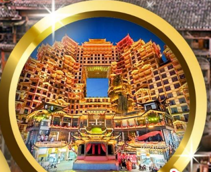
ชมตึกมหิตจรรย 72 ชั้น