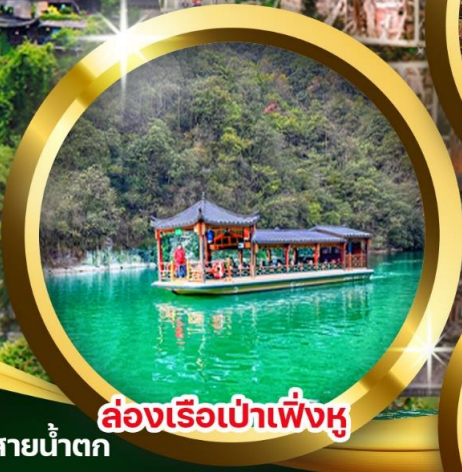
ล่องเรือป่าเฟิ่งหู