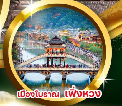
เมืองโบราณ เฟิ่งหวง