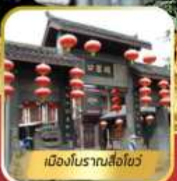
เมืองโบราณลือฮั่ว