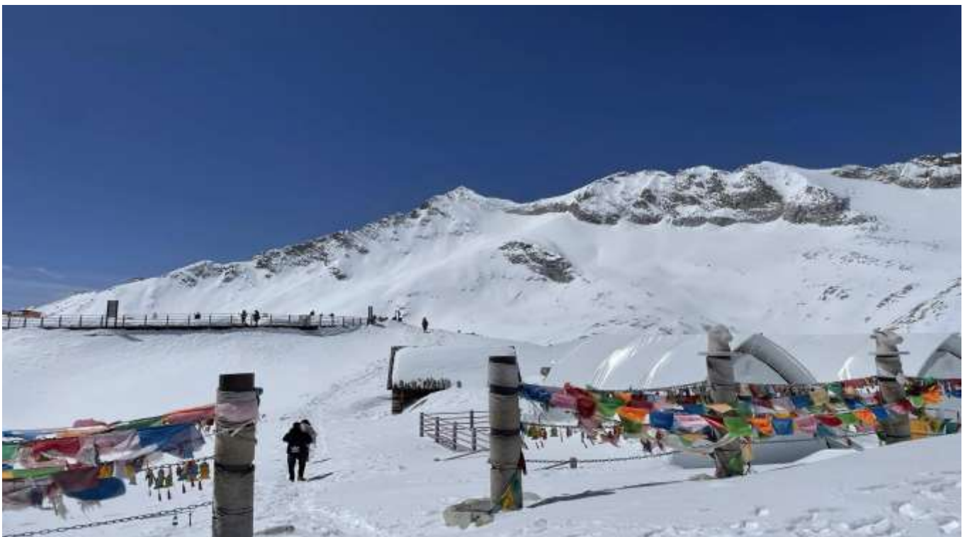
หลังจากนั้นนำท่านเดินทางกลับสู่ เมืองเจิงตู