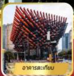
อาคารตะเกียบ