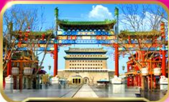
ถนนคนเดินเจ้บหม้บ

📱 vietjetair.com บบ. 20 กก. ✈️ บบ. 30 กก.