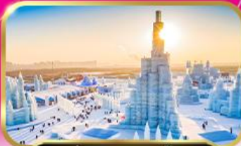
เข้าท้ยวทศกาลน้ำแข็ง

ไปรษณ้หมู้บ้านห้บะ • ถนนคนเดินแสรุ่นเจ้บ • ต้กตาท้บะย้กั • สะพานรตไฟบ้บโจว • อนุสาวรีย้ฝ้งหว • ซ้อบ้บ้งถนนจวหยาง