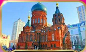
เซ้คอินโบสถ์เซนต์โซเฟีย