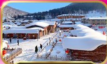
หมู้บ้านห้บะ (สโนว์ทาวน์)