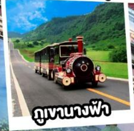
ภูเขานางฟ้า