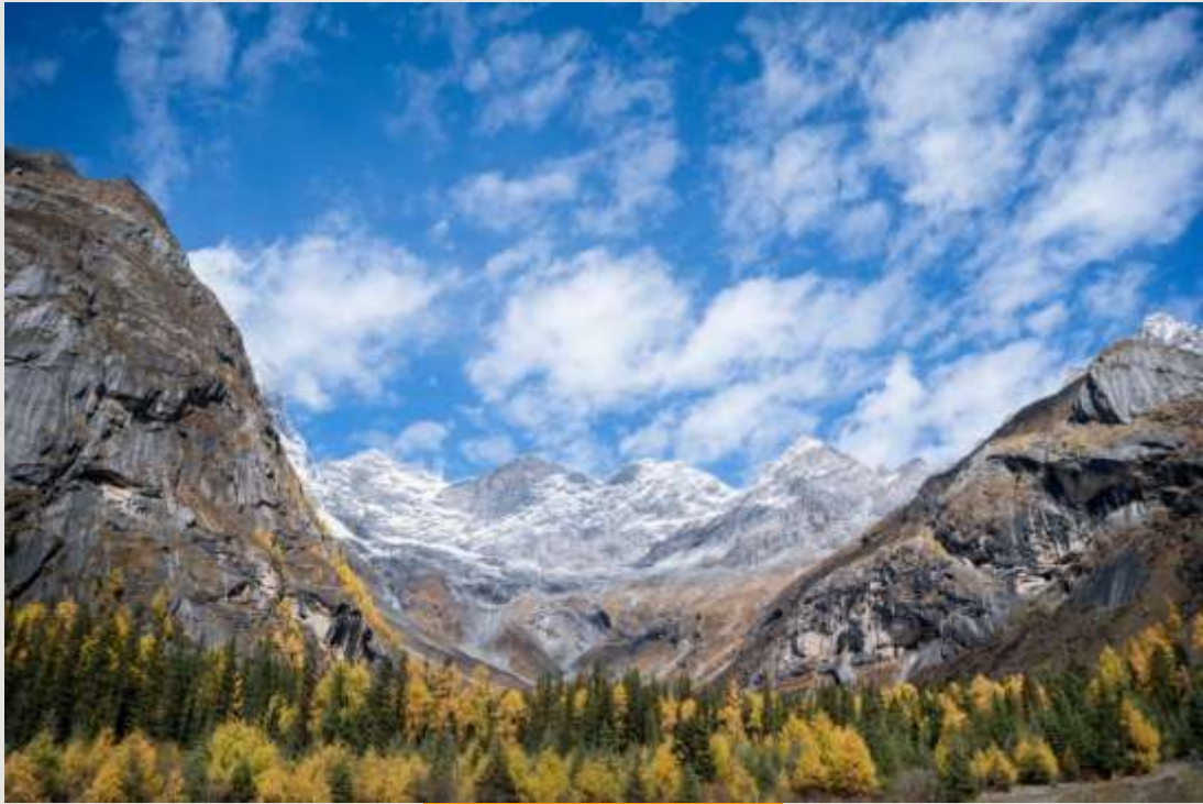
ฤดูใบไม้ร่วง (AUTUMN)